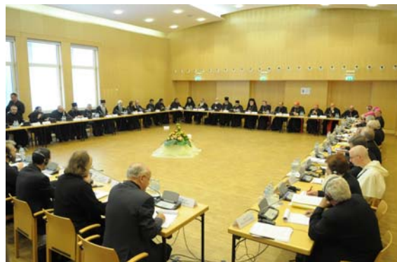
Ședință de lucru a Comisiei Internationale Mixte

La încheierea întâlnirii de dialog teologic de la Viena nu a rezultat un document final, ci doar un document de lucru. Încă de la începutul întâlnirii am aflat că Biserica Ortodoxă nu dorește să aibă un document comun pe baza textului propus deja, ci dorește ca acest text să rămână un text de lucru. S-au împărtășit diferite opinii de o parte și de cealaltă. Unii profesori de istorie și patrologie din partea delegației catolice au depus un efort în alcătuirea documentului și țineau mult să existe un document comun. Reprezentanții Bisericii Ortodoxe însă au manifestat multă îndoială, pentru că, după opinia lor, documentul era unilateral, prezenta doar aspectele pozitive ale primatului Episcopului Romei, trecând oarecum cu vederea anumite aspecte negative din primul mileniu. De aceea, s-a considerat că acest document nu poate constitui baza unui document comun, chiar îmbunătățit fiind. Repet, acest document a fost alcătuit și propus de reprezentanți ai ambelor Biserici.