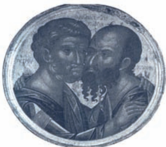
Îmbrățișarea apostolilor Petru și Paul (sec.XVI, Patmos)

Unitatea credinței nu înseamnă neapărat anularea tuturor particularităților și uniformizare reducionista. Biserica s-a manifestat în primul mileniu într-o diversitate acceptabilă tocmai pentru că erau respectate fundamentele credinței.