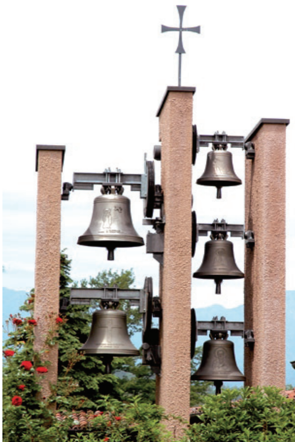
Clopoțele Mănăstirii ecumenice din Bose–Italia din nord

Proiectul de a culege și prezenta rezultatele dialogurilor oficiale între Biserica Catholică și Bisericile istorice protestante (luterani, reformați, anglicani, metodiști) a început în anul 2007 cu intenția de a face cunoscute roadele a 40 de ani de muncă.